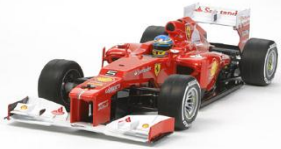
KIT RC 1:10